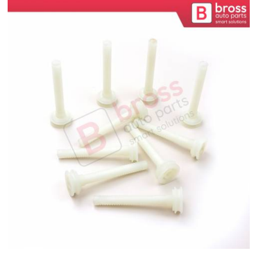
BCP053 10 Adet Cam Kriko İndirme Kaldırma Mekanizma Kablo Ucu Halat Dübeli Tip BCP053