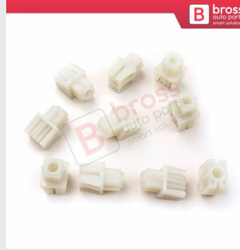
BCP056 10 Adet Cam Kriko İndirme Kaldırma Mekanizma Kablo Ucu Halat Dübeli Tip BCP056