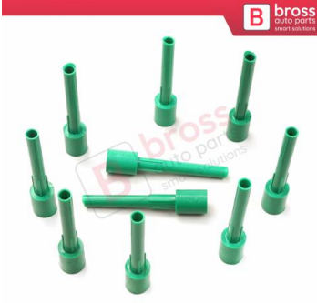
BCP050 10 Adet Cam Kriko İndirme Kaldırma Mekanizma Kablo Ucu Halat Dübeli Tip BCP050