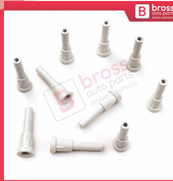
BCP035 10 Adet Cam Kriko İndirme Kaldırma Mekanizma Kablo Ucu Halat Dübeli Tip BCP035