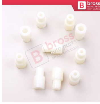
BCP015 10 Adet Cam Kriko İndirme Kaldırma Mekanizma Kablo Ucu Halat Dübeli Tip BCP015