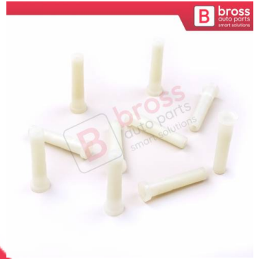
BCP036 10 Adet Cam Kriko İndirme Kaldırma Mekanizma Kablo Ucu Halat Dübeli Tip BCP036