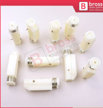
BCP054 10 Adet Cam Kriko İndirme Kaldırma Mekanizma Kablo Ucu Halat Dübeli Tip BCP054