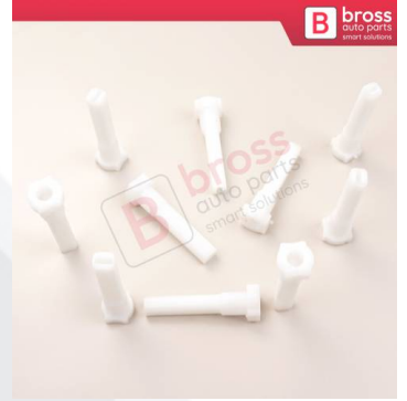
BCP057 10 Adet Cam Kriko İndirme Kaldırma Mekanizma Kablo Ucu Halat Dübeli Tip BCP057