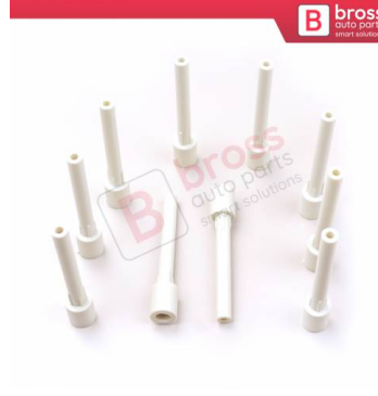
BCP052 10 Adet Cam Kriko İndirme Kaldırma Mekanizma Kablo Ucu Halat Dübeli Tip BCP052