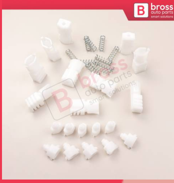
BCP029 10 Adet Cam Kriko İndirme Kaldırma Mekanizma Kablo Ucu Halat Dübeli Tip BCP029