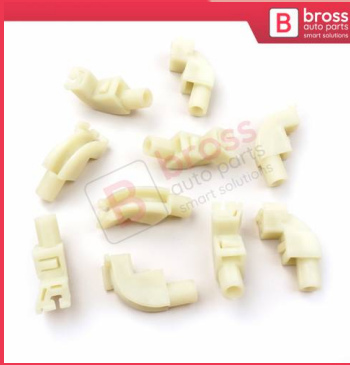
BCP033 10 Adet Cam Kriko İndirme Kaldırma Mekanizma Kablo Ucu Halat Dübeli Tip BCP033