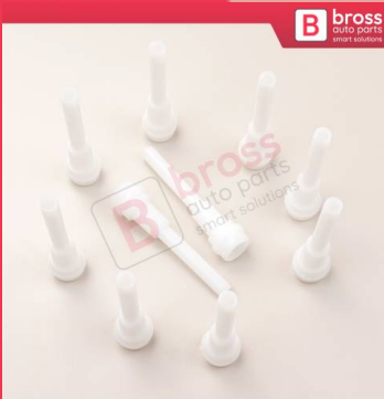
BCP058 10 Adet Cam Kriko İndirme Kaldırma Mekanizma Kablo Ucu Halat Dübeli Tip BCP058