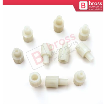
BCP016 10 Adet Cam Kriko İndirme Kaldırma Mekanizma Kablo Ucu Halat Dübeli Tip BCP016