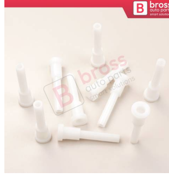
BCP039 10 Adet Cam Kriko İndirme Kaldırma Mekanizma Kablo Ucu Halat Dübeli Tip BCP039