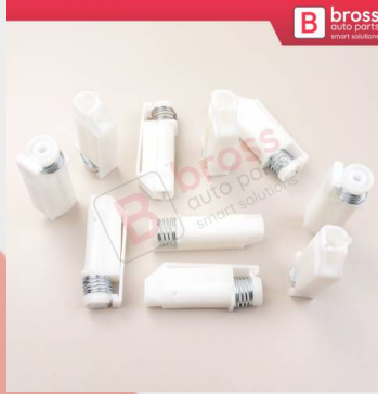
BCP055 10 Adet Cam Kriko İndirme Kaldırma Mekanizma Kablo Ucu Halat Dübeli Tip BCP055