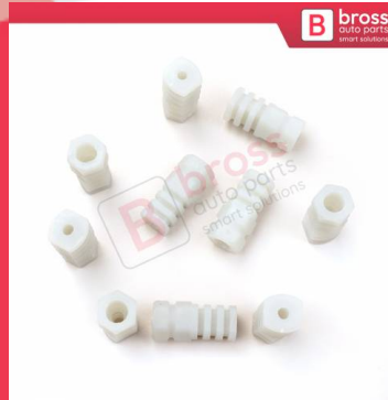
BCP023 10 Adet Cam Kriko İndirme Kaldırma Mekanizma Kablo Ucu Halat Dübeli Tip BCP023