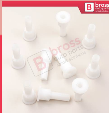
BCP059 10 Adet Cam Kriko İndirme Kaldırma Mekanizma Kablo Ucu Halat Dübeli Tip BCP059