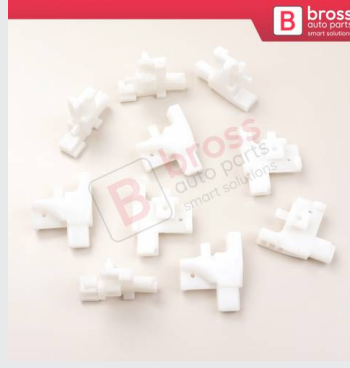
BCP031 10 Adet Cam Kriko İndirme Kaldırma Mekanizma Kablo Ucu Halat Dübeli Tip BCP031