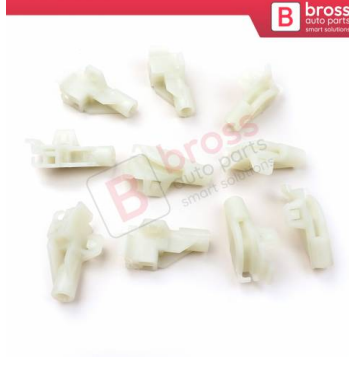
BCP038 10 Adet Cam Kriko İndirme Kaldırma Mekanizma Kablo Ucu Halat Dübeli Tip BCP038