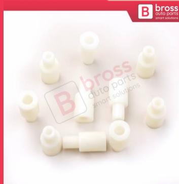
BCP021 10 Adet Cam Kriko İndirme Kaldırma Mekanizma Kablo Ucu Halat Dübeli Tip BCP021