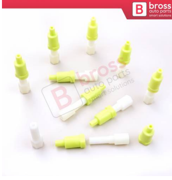
BCP025 10 Adet Cam Kriko İndirme Kaldırma Mekanizma Kablo Ucu Halat Dübeli Tip BCP025