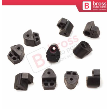
BCP014 10 Adet Cam Kriko İndirme Kaldırma Mekanizma Kablo Ucu Halat Dübeli Tip BCP014