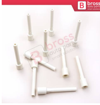
BCP051 10 Adet Cam Kriko İndirme Kaldırma Mekanizma Kablo Ucu Halat Dübeli Tip BCP051