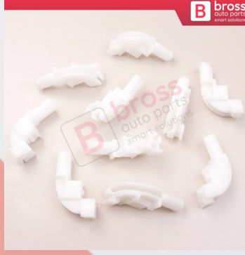
BCP042 10 Adet Cam Kriko İndirme Kaldırma Mekanizma Kablo Ucu Halat Dübeli Tip BCP042