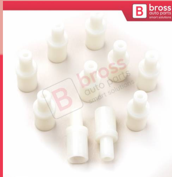
BCP022 10 Adet Cam Kriko İndirme Kaldırma Mekanizma Kablo Ucu Halat Dübeli Tip BCP022