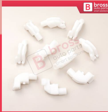
BCP034 10 Adet Cam Kriko İndirme Kaldırma Mekanizma Kablo Ucu Halat Dübeli Tip BCP034