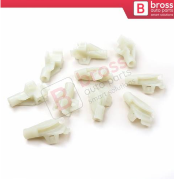
BCP037 10 Adet Cam Kriko İndirme Kaldırma Mekanizma Kablo Ucu Halat Dübeli Tip BCP037