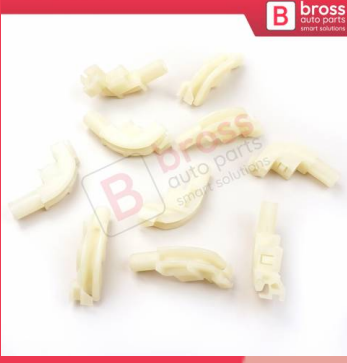
BCP041 10 Adet Cam Kriko İndirme Kaldırma Mekanizma Kablo Ucu Halat Dübeli Tip BCP041