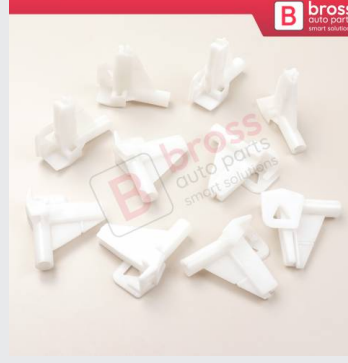
BCP043 10 Adet Cam Kriko İndirme Kaldırma Mekanizma Kablo Ucu Halat Dübeli Tip BCP043