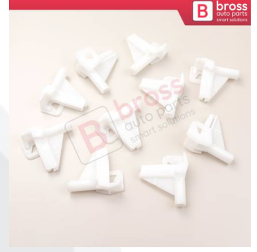
BCP044 10 Adet Cam Kriko İndirme Kaldırma Mekanizma Kablo Ucu Halat Dübeli Tip BCP044