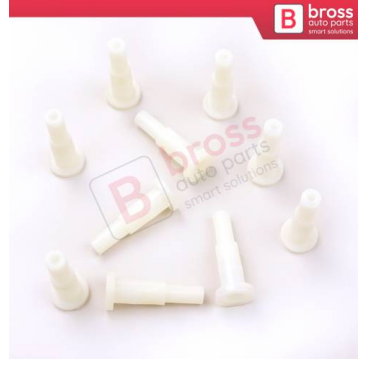
BCP028 10 Adet Cam Kriko İndirme Kaldırma Mekanizma Kablo Ucu Halat Dübeli Tip BCP028