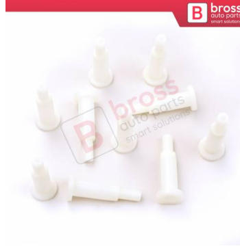
BCP027 10 Adet Cam Kriko İndirme Kaldırma Mekanizma Kablo Ucu Halat Dübeli Tip BCP027