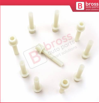
BCP045 10 Adet Cam Kriko İndirme Kaldırma Mekanizma Kablo Ucu Halat Dübeli Tip BCP045