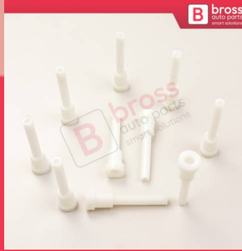
BCP046 BCP046 Kablo ucu Pipo