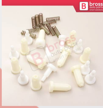
BCP030 10 Adet Cam Kriko İndirme Kaldırma Mekanizma Kablo Ucu Halat Dübeli Tip BCP030