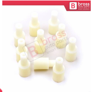
BCP024 10 Adet Cam Kriko İndirme Kaldırma Mekanizma Kablo Ucu Halat Dübeli Tip BCP024