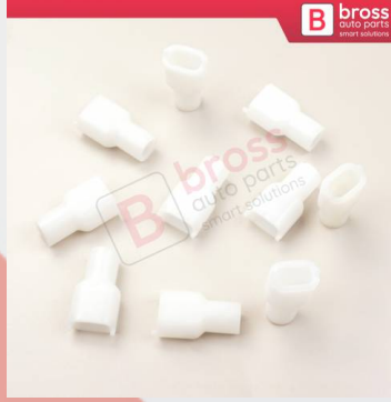
BCP018 10 Adet Cam Kriko İndirme Kaldırma Mekanizma Kablo Ucu Halat Dübeli Tip BCP018