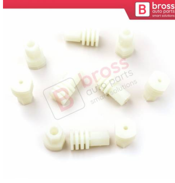
BCP026 10 Adet Cam Kriko İndirme Kaldırma Mekanizma Kablo Ucu Halat Dübeli Tip BCP026