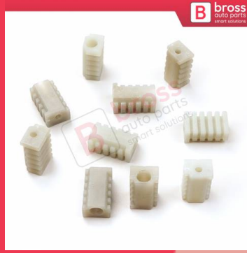
BCP017 10 Adet Cam Kriko İndirme Kaldırma Mekanizma Kablo Ucu Halat Dübeli Tip BCP017