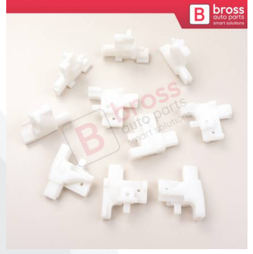
BCP032 10 Adet Cam Kriko İndirme Kaldırma Mekanizma Kablo Ucu Halat Dübeli Tip BCP032