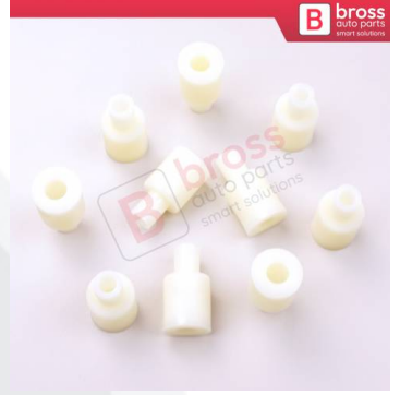
BCP020 10 Adet Cam Kriko İndirme Kaldırma Mekanizma Kablo Ucu Halat Dübeli Tip BCP020