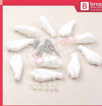
BCP048 BCP048 Cam Kriko Halat Ucu