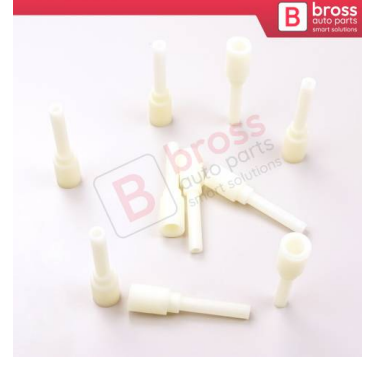
BCP040 10 Adet Cam Kriko İndirme Kaldırma Mekanizma Kablo Ucu Halat Dübeli Tip BCP040