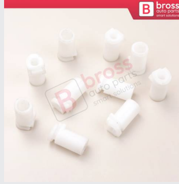
BCP019 10 Adet Cam Kriko İndirme Kaldırma Mekanizma Kablo Ucu Halat Dübeli Tip BCP019