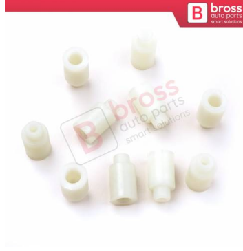
BCP013 10 Adet Cam Kriko İndirme Kaldırma Mekanizma Kablo Ucu Halat Dübeli Tip BCP013