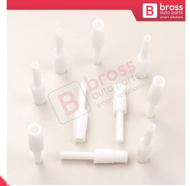
BCP049 10 Adet Cam Kriko İndirme Kaldırma Mekanizma Kablo Ucu Halat Dübeli Tip BCP049