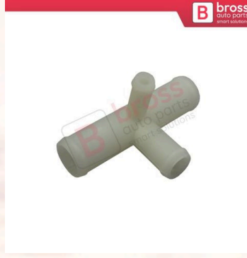
BHC643 Renault 9 11 21 İçin 1 Adet Soğutma Devirdaim Rekoru 7705030158