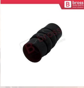
BHC650 Connect Fiesta Focus Turnier İçin Turbo Hava Hortumu 5T166N650AB