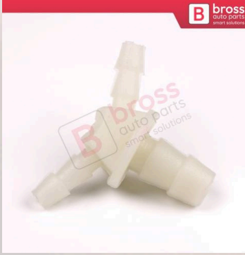
BHC658 Mercedes Ssang Yong için Silindir Karter Yağ Basıncı Düşürücü Valf Konnektörü 1110180009