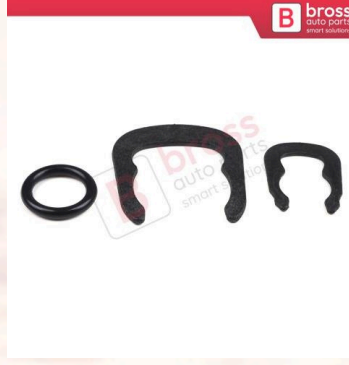
BHC659 VW Audi Seat Skoda için Termostat Müşür Plastik Sekmanı 032121142A