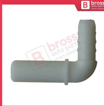
BHC652 Mercedes C W203 S203 CLK C209 A209 için Fren Servo Hattı Tamir Parçası 2034305129