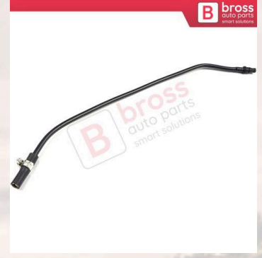
BHC664 Mercedes E Class W211 OM646 2.1 D için Motor Soğutucu Taşma Hortumu Havalandırma Borusu 2115011525