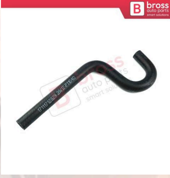
BHC22 BMW İçin Radyotör Soğutucu Ara Bağlantı Hortumu 17111712329