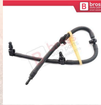
BHC640 Mercedes Sprinter Vito W639 İçin Geri Dönüş Hortumu 6510702432