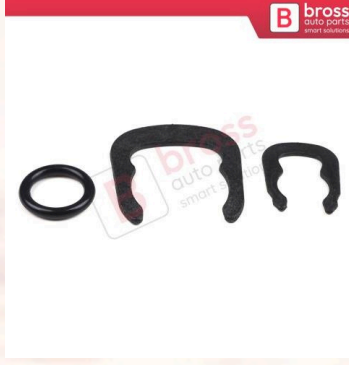
BHC659 VW Audi Seat Skoda için Termostat Müşür Plastik Sekmanı 032121142A