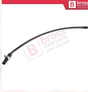
BHC661 Mercedes E Class W211 OM646 için Motor Soğutucu Taşma Hortumu Havalandırma Borusu 2115010225