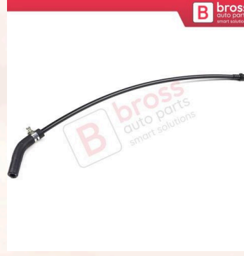
BHC665 Mercedes E Class W211 E320 E280 OM648 3.2 D için Motor Soğutucu Taşma Hortumu Havalandırma Borusu 2115011525