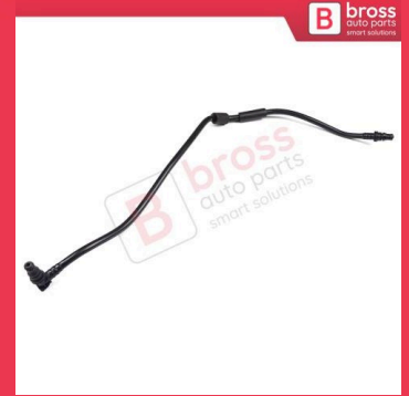
BHC663 Mercedes W211 E63 AMG C219 CLS63 AMG M156 6.2 L için Motor Soğutucu Taşma Hortumu Havalandırma Borusu 2115011625