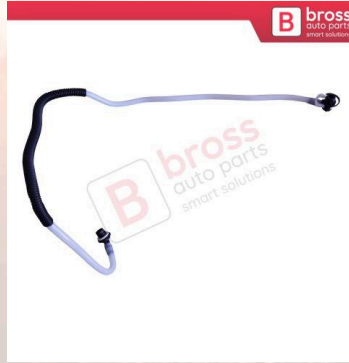
BHC638 Mercedes Sprinter Vito 638 C E V Class İçin Dizel Yakıt Ara Hortumu 6110702932