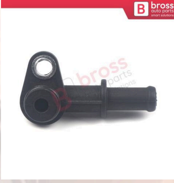
BHC656 Porsche Cayenne Panamera için Su Soğutma Alternatör Hortumu Bağlantı Parçası Baypas Hattı Adaptörü 94810646200