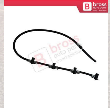
BHC649 Mercedes Sprinter 2.2 CDI Yakıt Geri Dönüş Hortumu A6460700932