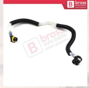
BHC636 Mercedes Sprinter Vito İçin Dizel Yakıt Ara Hortumu A6110706832