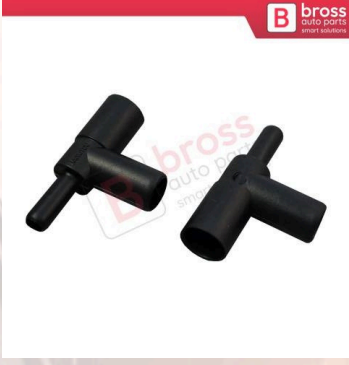
BHC642 Renault 9 11 İçin 2 Adet Karbüratör T Rekoru 7705030125