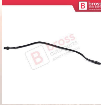
BHC662 Mercedes W211 E 500 C219 CLS 500 M113.967 için Motor Soğutucu Taşma Hortumu Havalandırma Borusu 2115010125