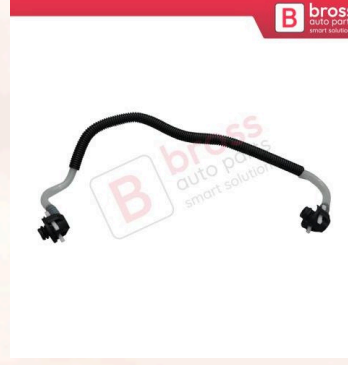
BHC635 Mercedes Sprinter Vito İçin Dizel Yakıt Ara Hortumu 6110702032