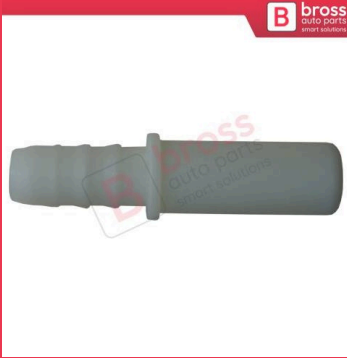
BHC651 Mercedes C W202 CLK430 için Fren Servosu Vakum Hortum 2024304629 Tamir Parçası