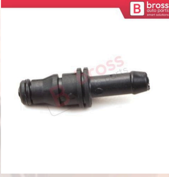
BHC632 Mercedes İçin Radyotör Havalandırma Hortum Parçası A0039970689