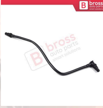
BHC660 Mercedes W211 C219 S211 için Motor Soğutucu Taşma Hortumu Havalandırma Borusu 211501092