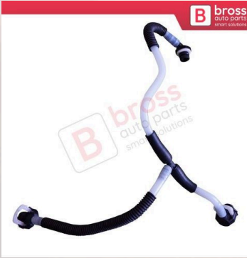
BHC637 Mercedes Sprinter 2000- 2006 İçin Dizel Yakıt Hortumu A6110707632