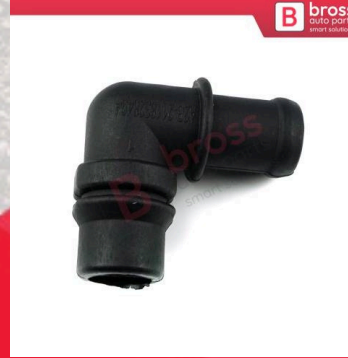
BHC655 Mercedes W203 A203 C203 CL203 CLK203 için Klima Isıtıcı Hortum Flans Bağlantısı 2038300596