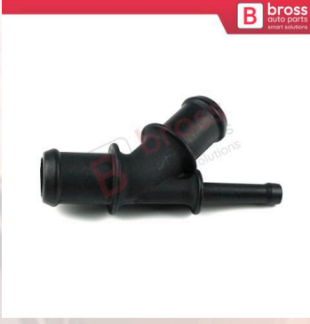
BHC654 VW Audi Seat Skoda için Radyatör Su Hortum Bağlantı Flanşı 1J0121087D