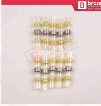
BHC503 4,0 6,0 mm 2 Kablo İçin 10 Adet Isıtmalı Birleştirme Parçası