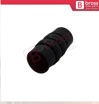
BHC650 Connect Fiesta Focus Turnier İçin Turbo Hava Hortumu 5T166N650AB