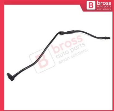
BHC663 Mercedes W211 E63 AMG C219 CLS63 AMG M156 6.2 L için Motor Soğutucu Taşma Hortumu Havalandırma Borusu 2115011625