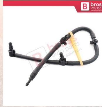
BHC640 Mercedes Sprinter Vito W639 için Geri Dönüş Hortumu 6510702432