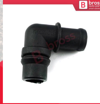
BHC655 Mercedes W203 A203 C203 CL203 CLK203 için Klima Isıtıcı Hortum Flans Bağlantısı 2038300596