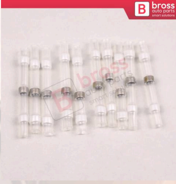
BHC500 0,1 0,5 mm 2 Kablo İçin 10 Adet Isıtmalı Parçası