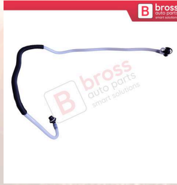
BHC638 Mercedes Sprinter Vito 638 C E V Class için Dizel Yakıt Ara Hortumu 6110702932