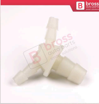
BHC658 Mercedes Ssang Yong için Silindir Karter Yağ Basıncı Düşürücü Valf Konnektörü 1110180009