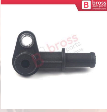
BHC656 Porsche Cayenne Panamera için Su Soğutma Alternatör Hortumu Bağlantı Parçası Baypas Hattı Adaptörü 94810646200