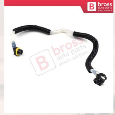
BHC636 Mercedes Sprinter Vito için Dizel Yakıt Ara Hortumu A6110706832