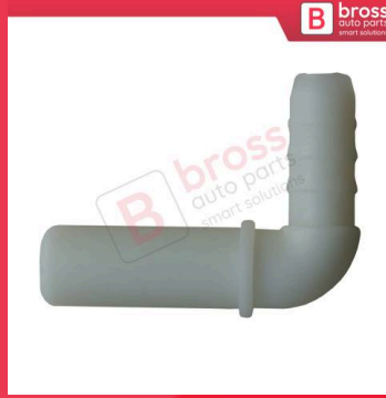
BHC652 Mercedes C W203 S203 CLK C209 A209 için Fren Servo Hattı Tamir Parçası 2034305129