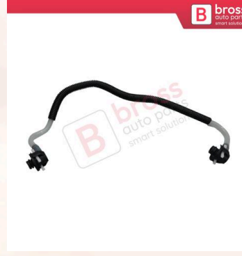
BHC635 Mercedes Sprinter Vito için Dizel Yakıt Ara Hortumu 6110702032