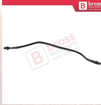
BHC662 Mercedes W211 E 500 C219 CLS 500 M113.967 için Motor Soğutucu Taşma Hortumu Havalandırma Borusu 2115010125