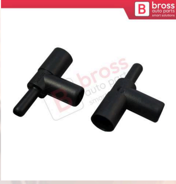
BHC642 Renault 9 11 İçin 2 Adet Karbüratör T Rekoru 7705030125