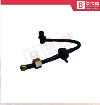
BHC645 Opel Astra G Vectra B İçin Fren Geri Dönüş Valfi Hortumu 90498464