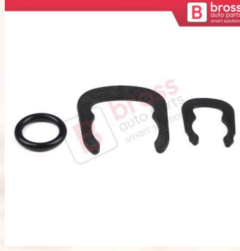
BHC659 VW Audi Seat Skoda için Termostat Müşür Plastik Sekmanı 032121142A