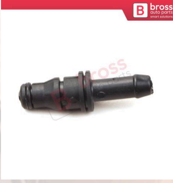
BHC632 Mercedes için Radyotör Havalandırma Hortum Parçası A0039970689