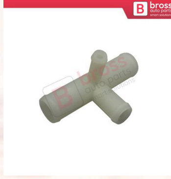
BHC643 Renault 9 11 21 İçin 1 Adet Soğutma Devirdaim Rekoru 7705030158