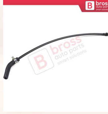
BHC665 Mercedes E Class W211 E320 E280 OM648 3.2 D için Motor Soğutucu Taşma Hortumu Havalandırma Borusu 2115011525