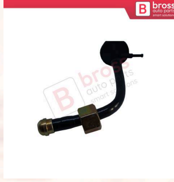
BHC646 Opel Vectra B İçin Fren Geri Dönüş Valfi Hortumlu 90497004