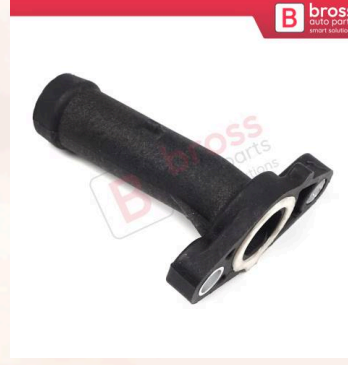
BHC657 Audi Q7 VW EOS CC Passat Touareg Porsche Cayenne Skoda Superb için Motor Soğutma Suyu Bağlantı Flanş Rekoru 03H121145A