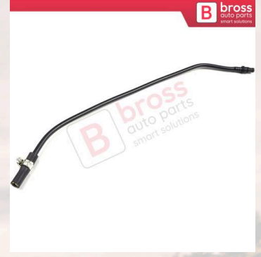
BHC664 Mercedes E Class W211 OM646 2.1 D için Motor Soğutucu Taşma Hortumu Havalandırma Borusu 2115011525