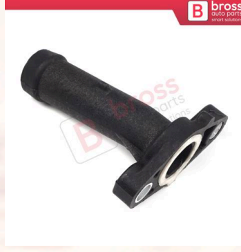
BHC657 Audi Q7 VW EOS CC Passat Touareg Porsche Cayenne Skoda Superb için Motor Soğutma Suyu Bağlantı Flanş Rekoru 03H121145A