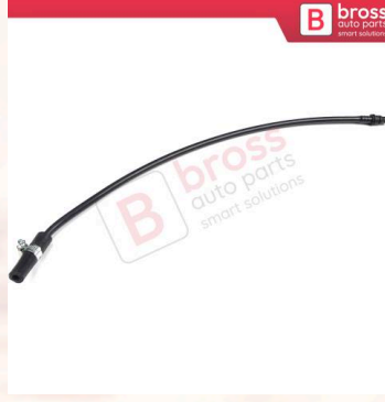
BHC661 Mercedes E Class W211 OM646 için Motor Soğutucu Taşma Hortumu Havalandırma Borusu 2115010225