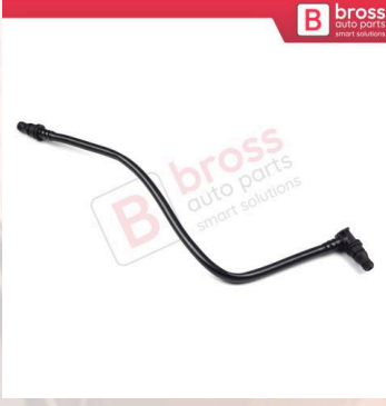
BHC660 Mercedes W211 C219 S211 için Motor Soğutucu Taşma Hortumu Havalandırma Borusu 211501092