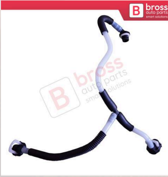
BHC637 Mercedes Sprinter 2000- 2006 için Dizel Yakıt Hortumu A6110707632