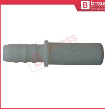
BHC651 Mercedes C W202 CLK430 için Fren Servosu Vakum Hortum 2024304629 Tamir Parçası