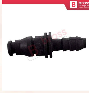
BHC633 Universal Genleşme Tankı Soğutucu Hortum Bağlantısı