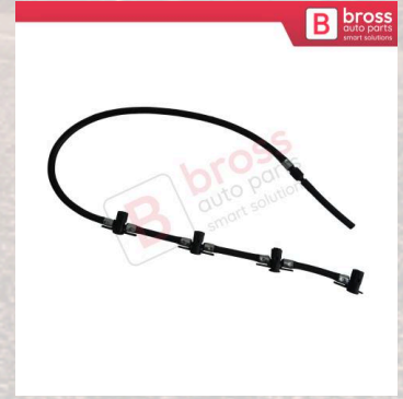
BHC649 Mercedes Sprinter 2 2 CDI Yakıt Geri Dönüş Hortumu A6460700932