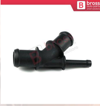
BHC654 VW Audi Seat Skoda için Radyatör Su Hortum Bağlantı Flanşı 1J0121087D