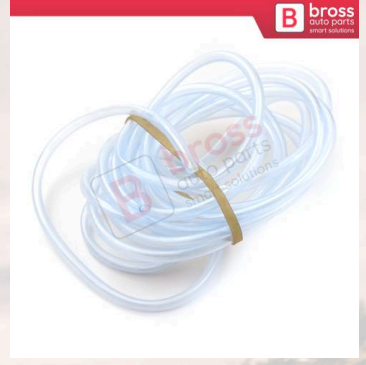
BHC644 Universal 3 Metre Cam Fiskiye Hortumu Çap 4mm