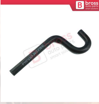
BHC22 BMW İçin Radyotör Soğutucu Ara Bağlantı Hortumu 17111712329