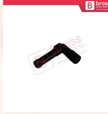
BHC647 Opel Astra G Vectra B Zafira A İçin Termostat Piposu 1338331